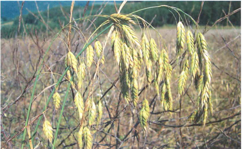
Abb. 2: Infloreszenz von B. grossus im FFH-Gebiet „Ackerflur bei Ulmet“

Die landwirtschaftliche Nutzung besteht in einer Fruchtfolge von Winterraps, Winterweizen und Sommerweizen, gelegentlich wird Grünland eingeschoben, wobei unterschiedliche betriebsspezifische Abfolgen bezüglich des Anbaus der einzelnen Fruchtarten zu finden sind. Zwar gilt B. grossus als spezifischer Begleiter von Dinkelkulturen, wie HÜGIN (2008) jedoch darlegte, ist die Dicke Trespe nicht an Dinkelkulturen gebunden. In allen ackerbaulichen Kulturen des Untersuchungsgebietes wurden bis zum Beginn intensiver Schutzmaßnahmen regelmäßig und flächendeckend Herbizide sowohl gegen dikotyle als auch gegen monokotyle unerwünschte Begleitpflanzen eingesetzt, so dass diese fast nur noch am Feldrand zu finden waren. Dieses galt vor allem für B. grossus , von dem ebenfalls nur wenige Exemplare an Feldrändern standen. Es wird vermutet, dass die Dicke Trespe nie ausgestorben war und das Gebiet bereits in Zeiten extensiver Nutzung vor der allgemeinen Herbizidanwendung besiedelt hatte. An Feldrändern überlebte sie die landwirtschaftliche Intensivierung, bis Fördermaßnahmen einsetzten und sie wieder Zugang auf die eigentlichen Ackerflächen fand.