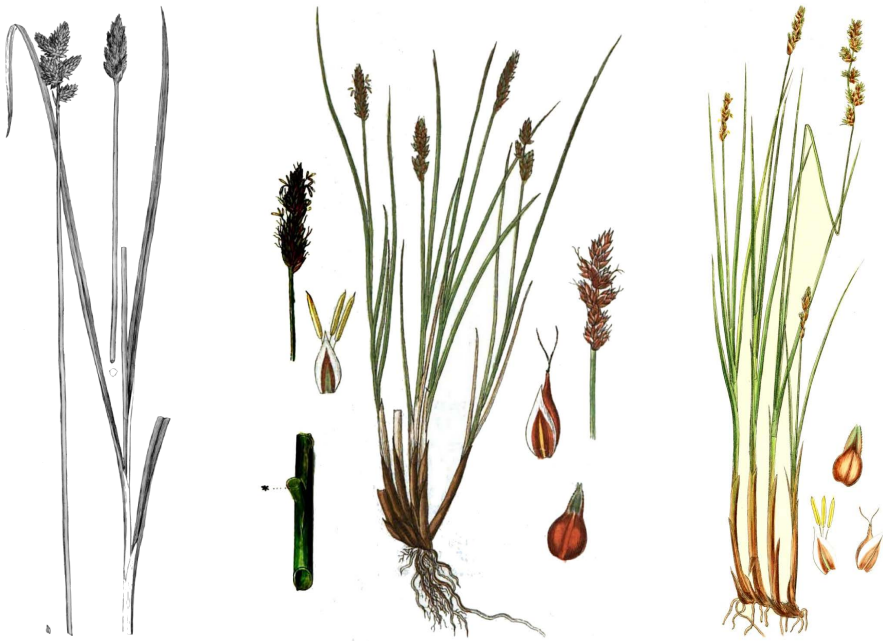
Abb.: 2 Links: erste Abbildung der Draht-Segge 1794 durch Samuel Goodenough; Mitte: 1835 durch Jakob Sturm; Rechts: 1846 durch Heinrich Gottlieb Ludwig Reichenbach. – Left: first illustration of the lesser tussock-sedge from 1794 by Samuel Goodenough; centre: illustration from 1835 by Jakob Sturm; right: illustration from 1846 by Heinrich Gottlieb Ludwig Reichenbach.