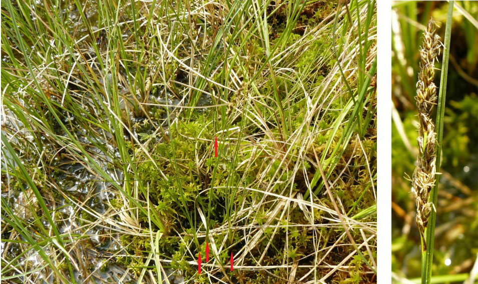
Abb. 4: Draht-Segge ( Carex diandra ) im Wehrdaer Moor, 15. Mai 2017. Links: Einzelne blühende Triebe; rechts: Blütenstand. – Lesser tussock-sedge ( Carex diandra ) in the Wehrda moor, 15 May 2017; left: flowering shoots, right: inflorescence.

Vegetationsaufnahmen zu Zeller Loch und Großem Moor bei Großenmoor aus Cezanne & Hodvina (1988a, 1998b).