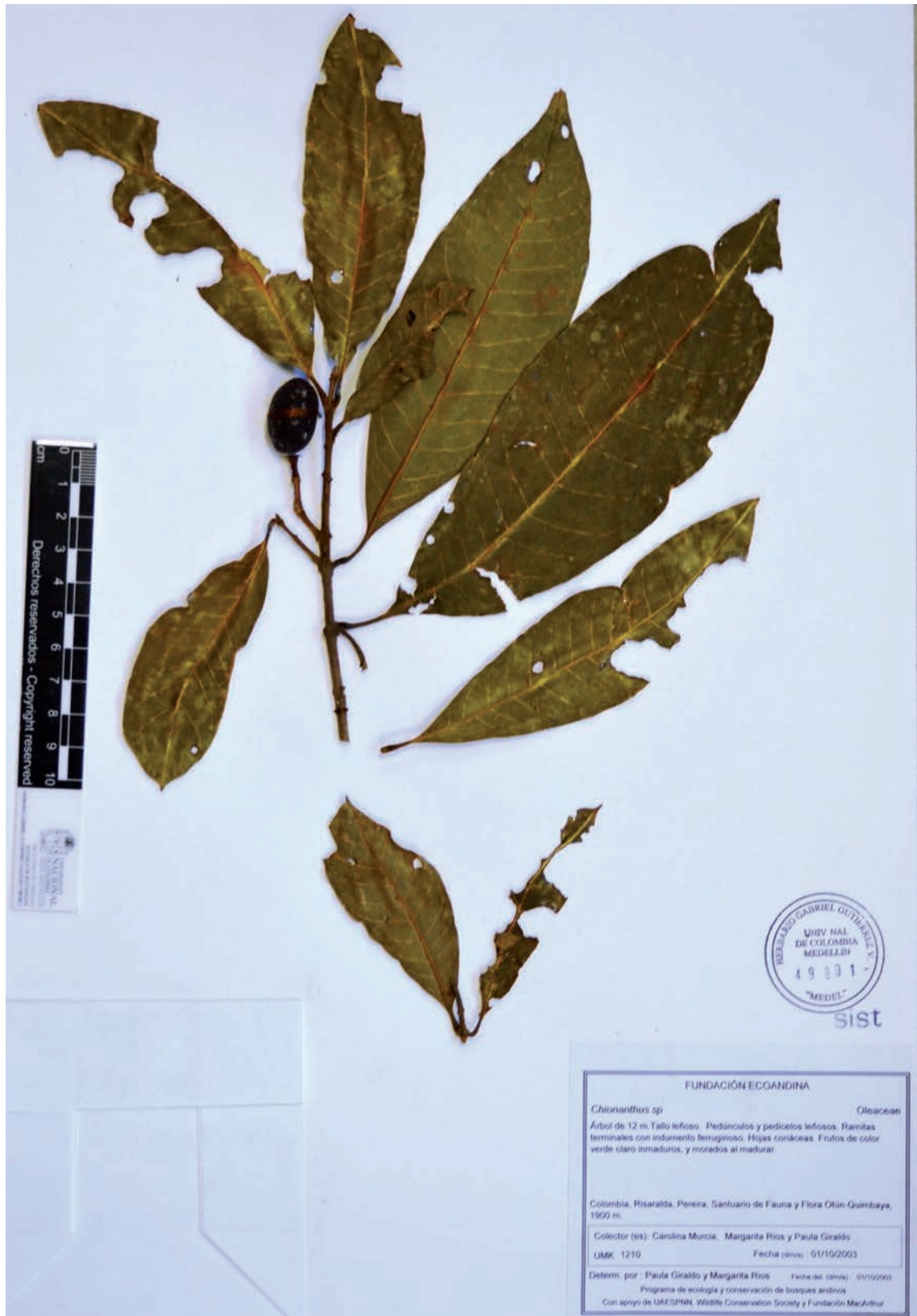
Fig. 6. Holotipo de Chionanthus vargasii [C. Murcia & al. 1210., MEDEL 49801].