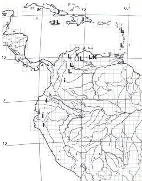
Fig. 9. (Continuación:) i, Ch. pubescens (i, plantas cultivadas); j, Ch. avilensis ; k, Ch. ligustrinus ; l, Ch. compactus .

como con datos insuficientes (DD), aunque es probable que pueda catalogarse más adelante en alguna categoría de amenaza —VU? —, dada su restringida distribución conocida y el uso local de que ha sido objeto.