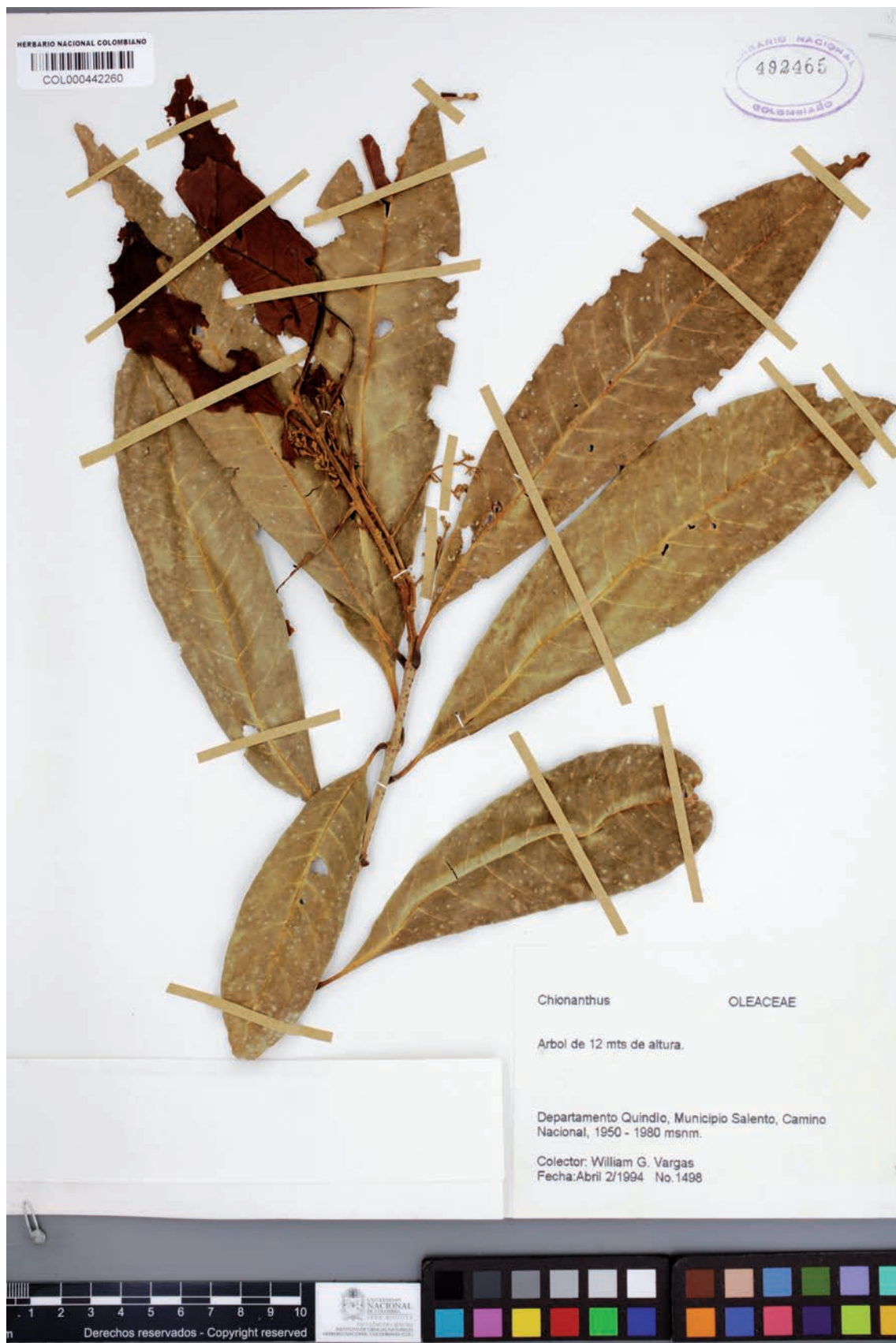
Fig. 7. Paratipo de Chionanthus vargasii [Vargas 1498, COL 492466].