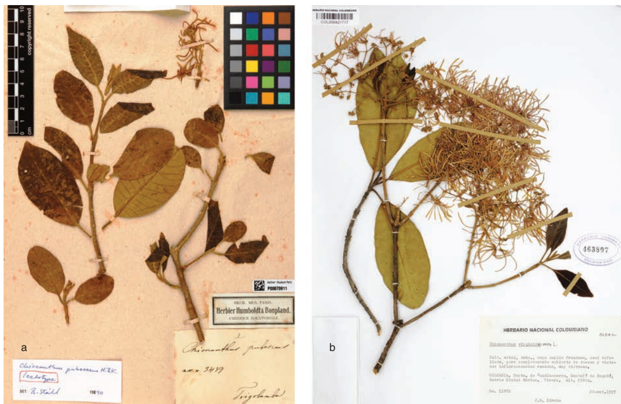
Fig. 5. Chionanthus pubescens : a, lectotipo; b, floración [a, Bonpland & Humboldt 3439 , P 670911; b, J.M. Idrobo 11958 , COL 463807].

Chionanthus vargasii has similarity in their leaves with Chionanthus abriaquiensis Fern. Alonso & Cogollo, but differs by its shorter petioles —13-20 mm—, vs. 25-35 mm in C. abriaquiensis ; leathery blade with woolly domatia below, and by its shorter inflorescences (8)10-12 cm length, vs. 20-28 cm in C. abriaquiensis .