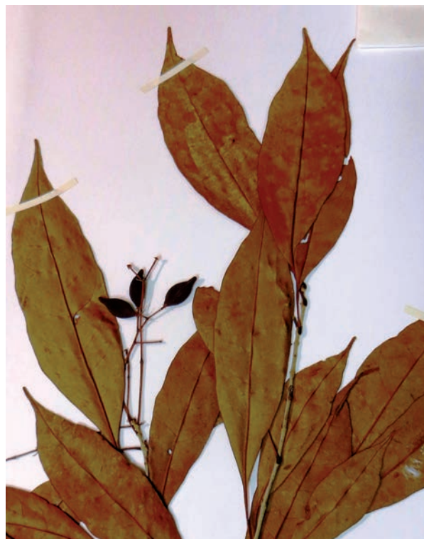
Fig. 4. Rama con frutos jóvenes de Chionanthus panamensis [ G. Lozano 5175 & al. , MA 530785].

Observaciones. —La planta descrita de la Isla de Gorgona como Ch. gorgonae , basada en una recolección con frutos, fue tratada como sinónimo de Ch. compactus por Lozano & Fuertes (1992) y Green (1994). En nuestra opinión, presenta una mayor afinidad morfológica y corológica con Ch. panamensis .