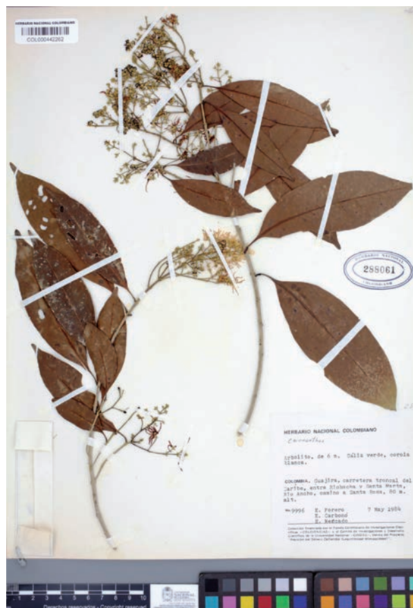
Fig. 2. Chionanthus compactus [E. Forero 9996, COL 288061].

Distribución y hábitat. —Ampliamente distribuida por Colombia, Venezuela y las antillas menores, generalmente por debajo de los 1000