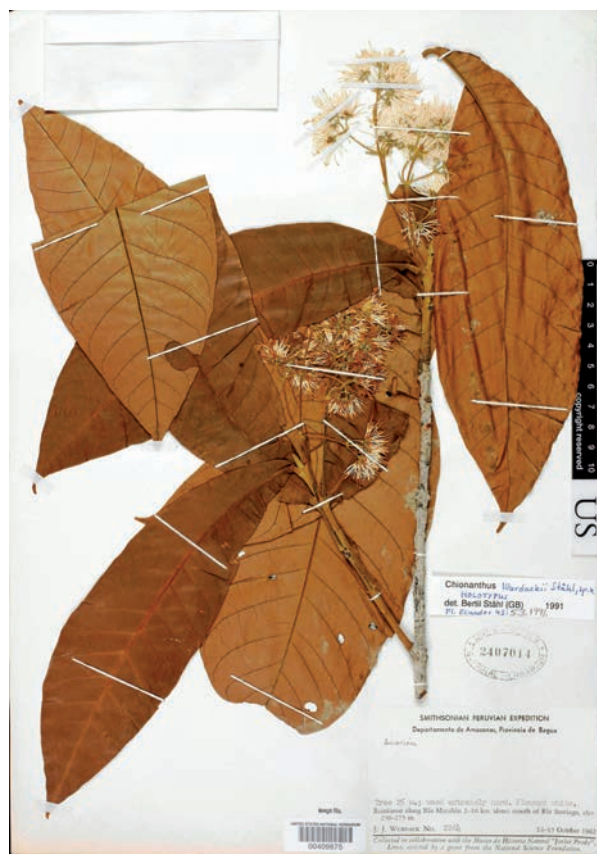
Fig. 8. Holotipo de Chionanthus wurdackii [J. Wurdack 2264, US 2407014].

Se trata de una especie escasa que está relegada a los relictos conservados de bosque, donde se encuentran aún ejemplares corpulentos. Su madera es muy apreciada para fabricar postes para las cercas de finca y también como madera para la construcción (Vargas, 2002). Algunas recolecciones que corresponden a árboles jóvenes de 10-12 m provienen de bosques secundarios en proceso de recuperación, tanto en la Reserva Otún-Quimbaya como en zonas aledañas del Parque Regional Natural Ucumari que forman parte del cinturón de amortiguación del Parque Nacional Natural de Los Nevados (Rangel, 1994; Ríos & al., 2004). De acuerdo con las categorías de la IUCN (2012) y a falta de información más precisa, se le catalogaría