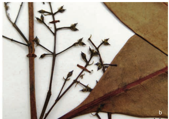
Fig. 3. Chionanthus implicatus : a, detalle de una rama con inflorescencias; b, detalle de infrutescencias con frutos jóvenes [a, García 682 , COAH 32110; b, J.L. Fernández-Alonso 23547 , fotografía de J.L. Fernández].