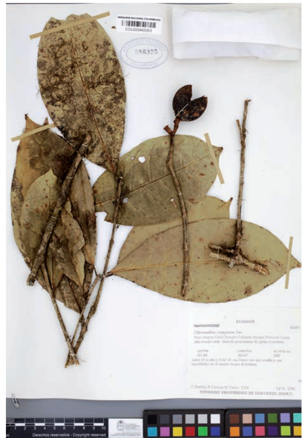
Fig. 1. Isotipo de Chionanthus colonchensis [ C. Bonifaz 3562 & X. Cornejo ; COL 586325].

Distribución y hábitat. —Especie solo conocida por las dos recolecciones de la localidad tipo (Fig. 9a). Habita en los bosques subandinos de Antioquia, entre los 1900 y 2800 m s.n.m., en la vertiente occidental de la Cordillera Occidental de Colombia.