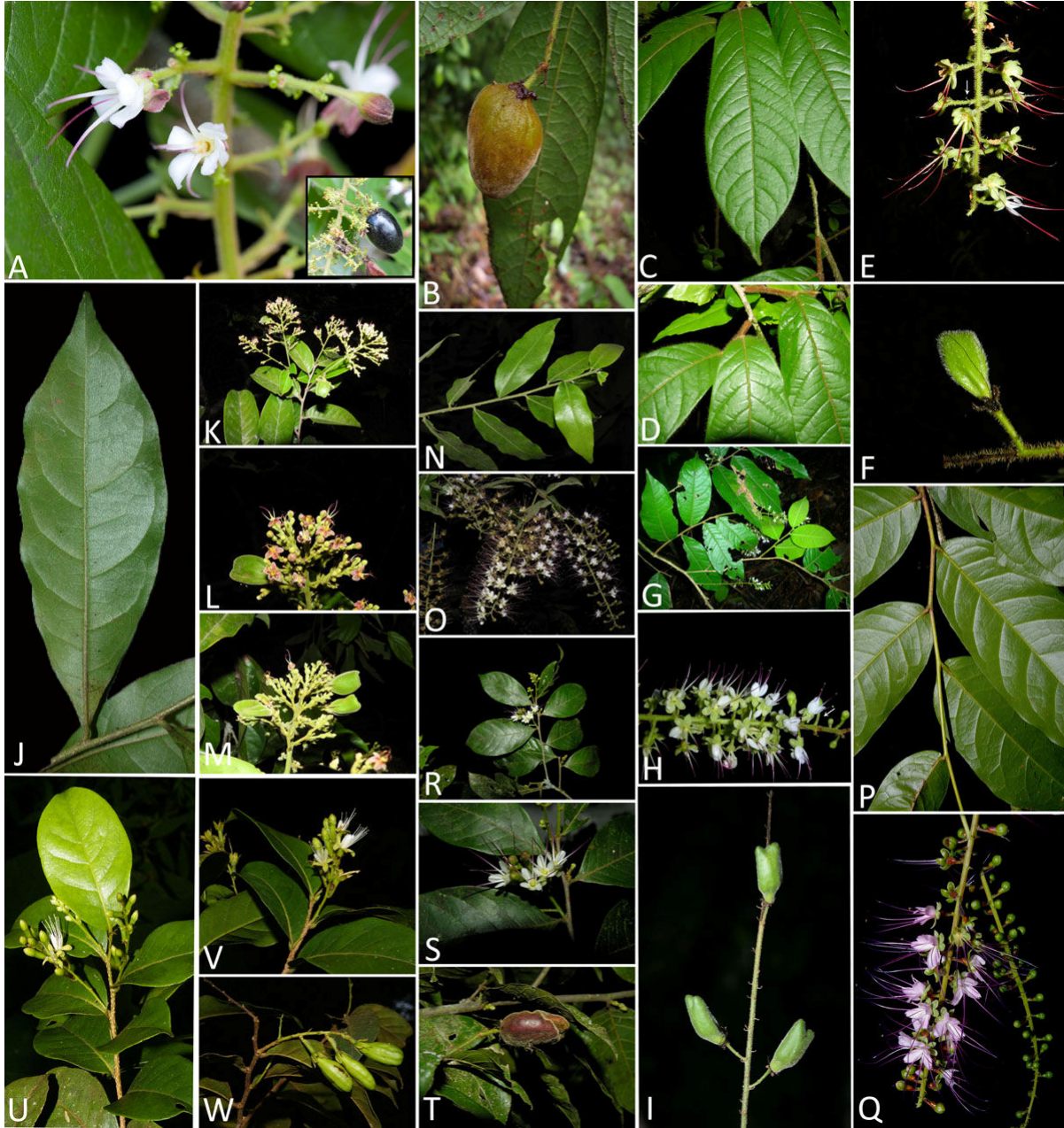
Figura 3. Especies de Hirtella en Costa Rica. A. Hirtella americana , flores, fruto maduro (en recuadro) y glándulas. B. H. guatemalensis , fruto y envés de la lámina foliar. C–F. H. lemsii , haz de las láminas foliares (C), ramita mostrando el indumento y bases de las láminas foliares (D), inflorescencia, flecha señalando la glándula (E), fruto (F). G–I. H. lemsii (vertiente del Caribe), rama con hojas e inflorescencias (G), flores, la flecha señalando el pedicelo eglandular (H), frutos (I). J. H. media , envés de las láminas foliares. K–M. H. papillata , rama con hojas e inflorescencias (K), flores (L), frutos (M). N, O. H. racemosa var. hexandra , rama con hojas (N), inflorescencias (O). P, Q. H. racemosa var. racemosa , envés de las láminas foliares (P), flores (Q). R–T. H. triandra , rama con hojas e inflorescencias (R), flores (S), fruto (T). U–W. H. tubiflora , rama con hojas e inflorescencias (U), botones florales y flores (V), frutos (W).