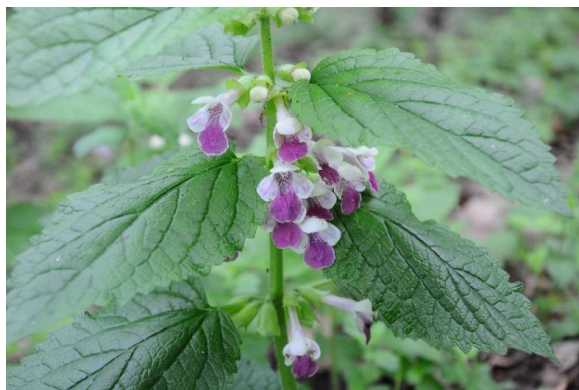
Melittis melissophyllum L.

tel. + 48 81 742 67 01, 81 743 49 00, 81 743 49 45 e-mail: botanik@mail.umcs.pl www.garden.umcs.lublin.pl