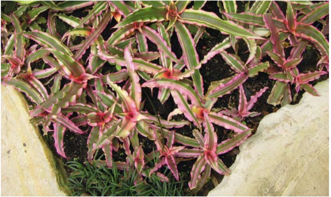
Cryptanthus "Rainbow star"