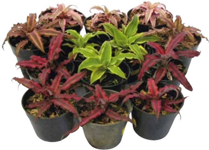
Aneka sosok cryptanthus , si bintang dunia

Genus ini terkenal dengan sebutan bintang bumi ( earth stars ) atau tanaman bintang ( starfish plant ). Sebutan itu melekat lantaran bentuk daun cryptanthus mirip bintang. Ia banyak dijumpai tumbuh subur di Brazil. Merupakan tanaman dengan anggota 36 spesies yang tersebar di Amerika Selatan.