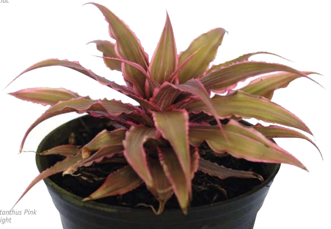
Cryptanthus Pink starlight