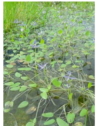
12 Heteranthera rotundifolia Hábito