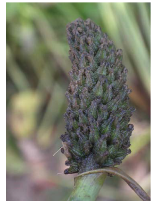
16 Pontederia parviflora Inflorescência