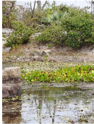
2 Macrófitas aquáticas, Cajueiro da Praia