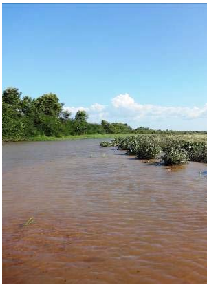
5 Ilha das Batatas-Litoral Piauiense