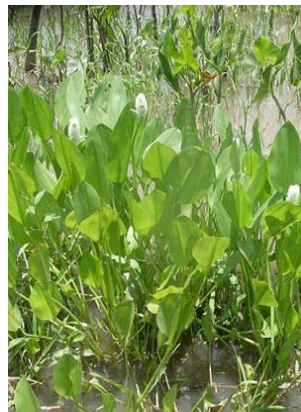
14 Pontederia parviflora Hábito