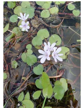
8 Eichhornia diversifolia Hábito