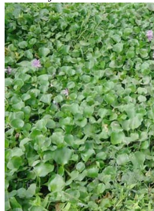
6 Eichhornia crassipes Hábito