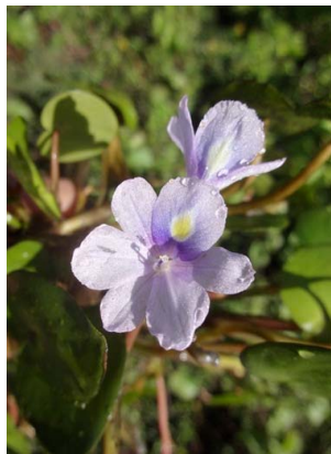
9 Eichhornia diversifolia Inflorescência