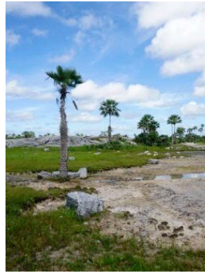
3 Vegetação litorânea, Cajueiro da Praia