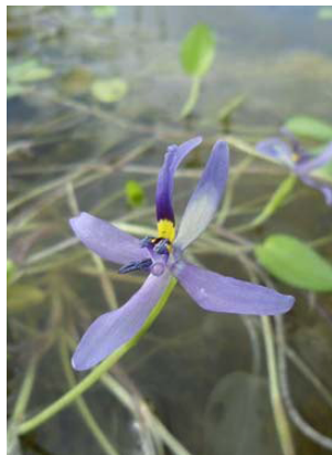
13 Heteranthera rotundifolia Inflorescência