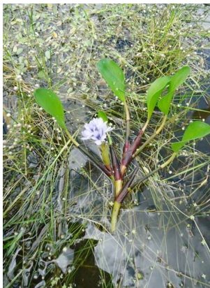
10 Eichhornia heterosperma Hábito