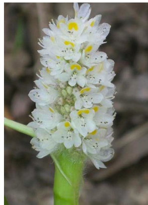
15 Pontederia parviflora Inflorescência