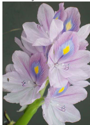
7 Eichhornia crassipes Inflorescência