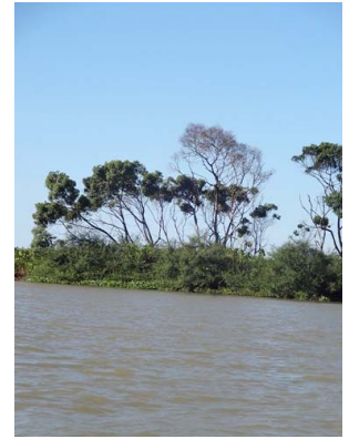
4 Rio Parnaíba, Delta do Parnaíba