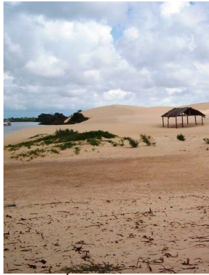
1 Área de duna, Ilha Grande do Piauí

[fieldguides.fieldmuseum.org] [489] versão 1 11/2017