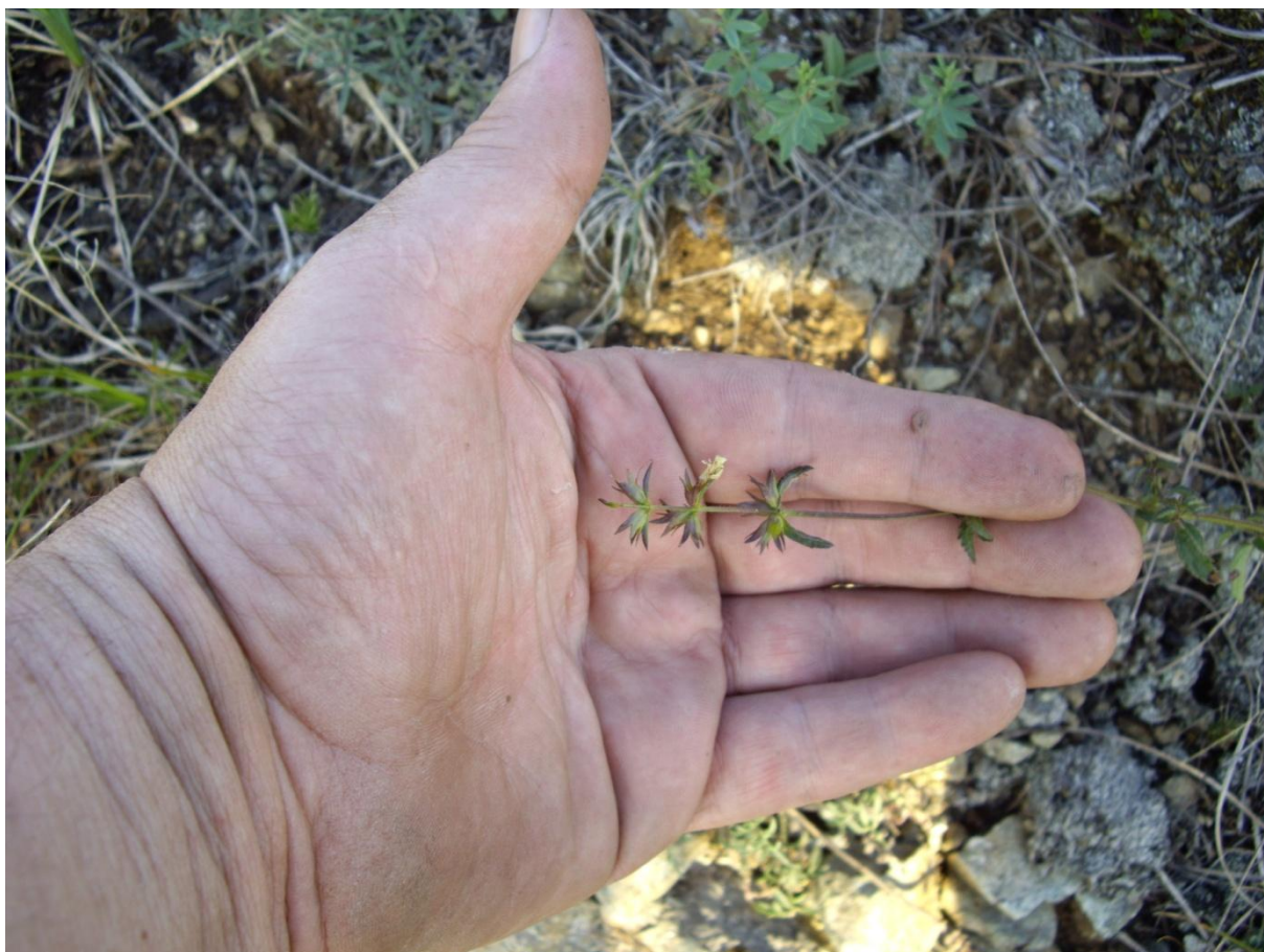
Slika 3 Stachys chamaedrys var. Zepcensis o veličini biljke