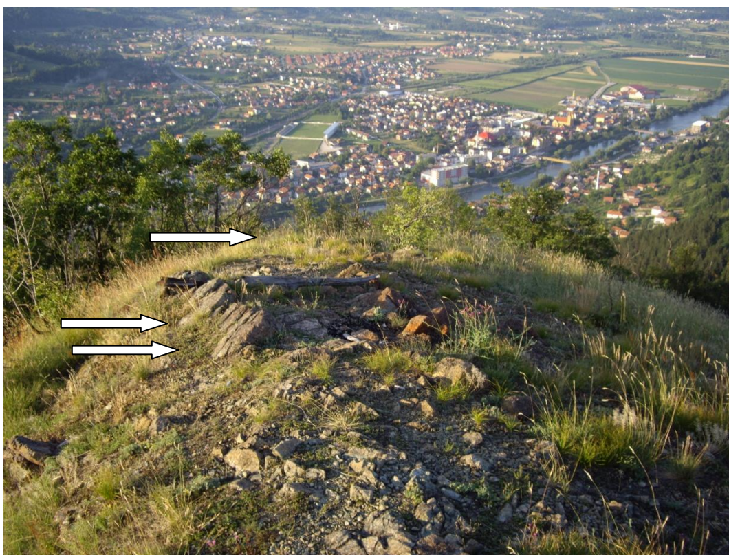
Slika 4 stanište Stachys chamaedrys var. Zepcensis