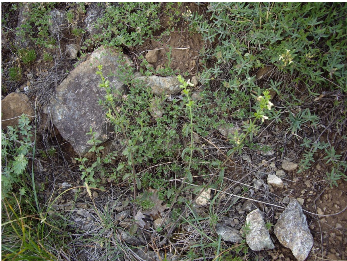
Slika 2 Stachys chamaedrys var. Zepcensis u cvijetu