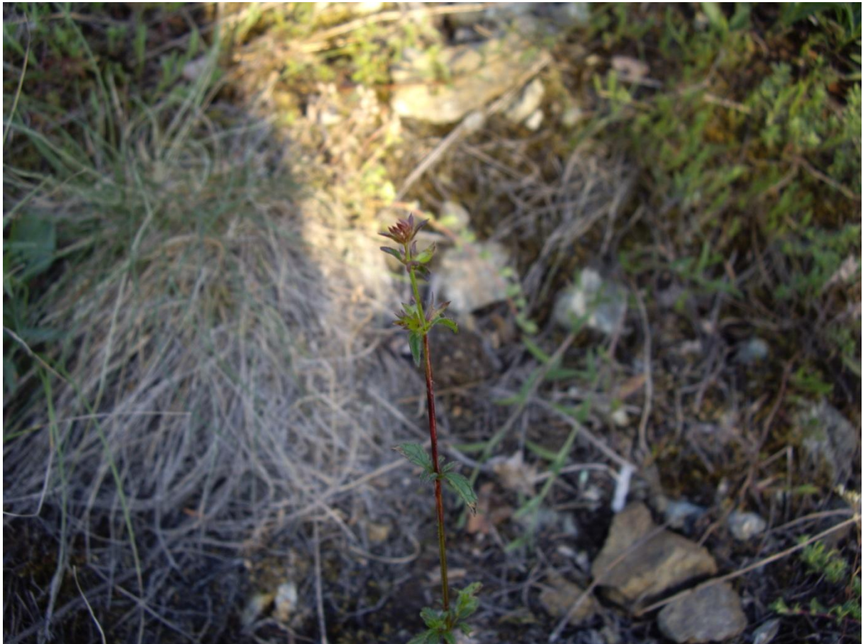
Slika 1 izgled biljke