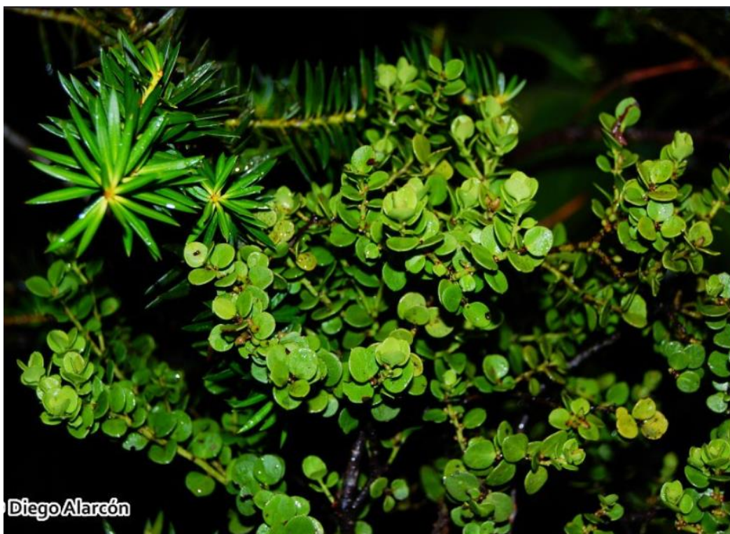
Figura 50. Antidaphne punctulata . Hábito y hojas.

Referencias: Marticorena, A., D. Alarcón, L. Abello & C. Atala. 2010. Guía de campo de plantas trepadoras, epífitas y parásitas nativas de Chile: 238-239.