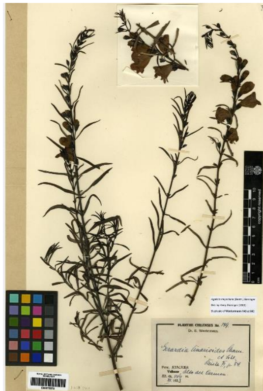
Figura 3. Agalinis meyeniana , ejemplar de Werdermann N.º 149 (en el Herbario de Edinburgo), coleccionado en Alto del Carmen, valle del Huasco.

Referencias: Barringer, K. A. 1987. New and noteworthy South American species of Agalinis (Scrophulariaceae). Brittonia 39: 353-357.