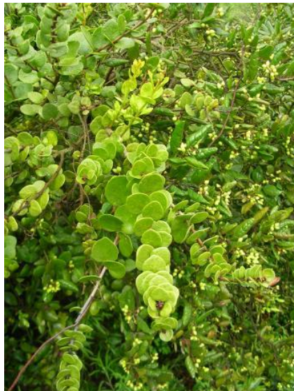
Figura 36. Notanthera heterophylla , hojas.

Referencias: Hoffmann, A. E. 1980. Flora Silvestre de Chile. Zona Central. p.112. Kuijt, J. 2011. Flora de Chile 3(1): 13.