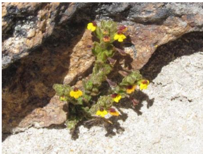
Figura 23. Neobartsia peruviana . Hábito. Volcán Tacora.

Referencia: Molau, Opera Botanica 102: 80. 1990.