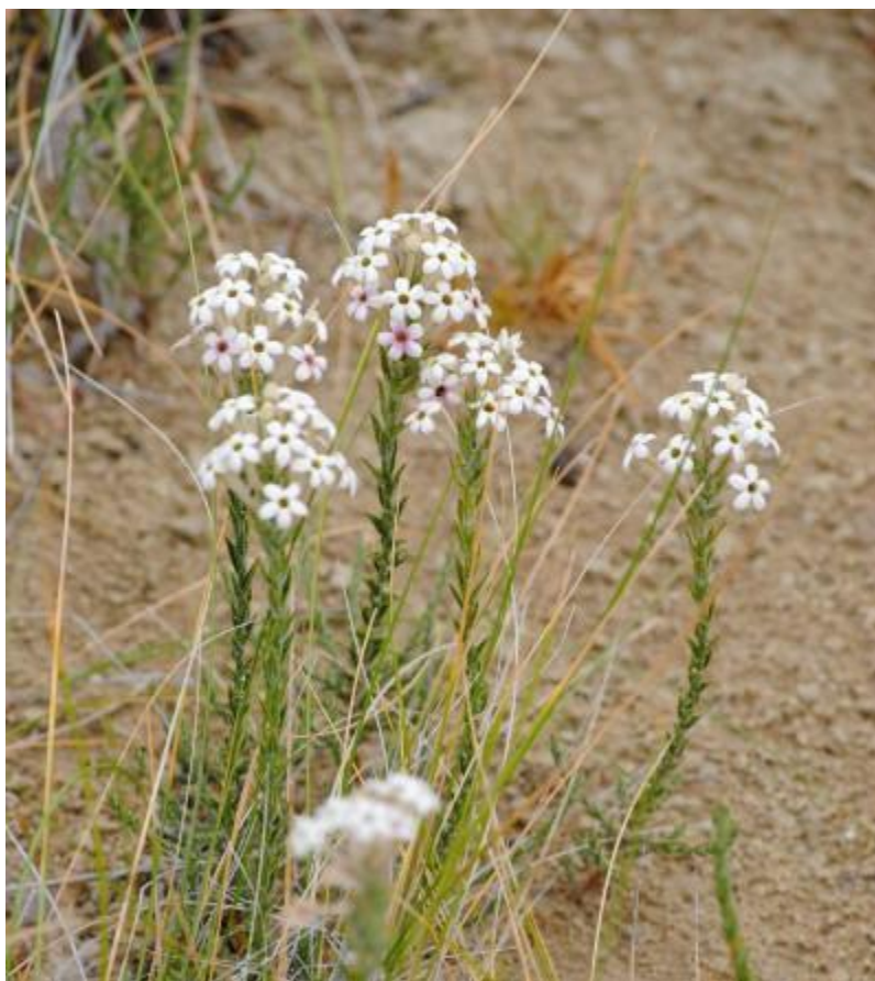
Figura 58. Arjona tuberosa . Imagen de referencia: imagen de referencia, Diego Quintana (en IBODA).

Estado de conservación: se desconoce. Por su amplia distribución en Argentina aparentemente no tendría problemas de conservación, pero en Chile es una planta escasa.