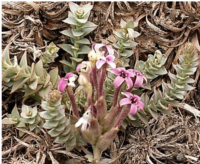
Figura 56. Arjona patagonica , hojas y flores.