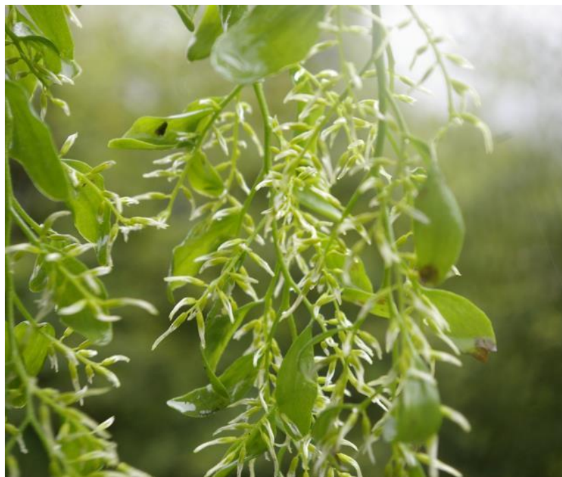
Figura 43. Misodendrum brachystachium , hábito y flores. Reserva biológica Huilo Huilo, Región de los Ríos.