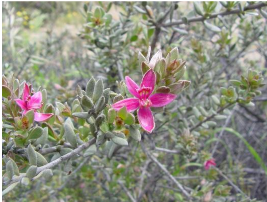
Figura 67. Krameria cistoidea , hojas y flores. Quebrada Algarrobal, Región de Atacama.