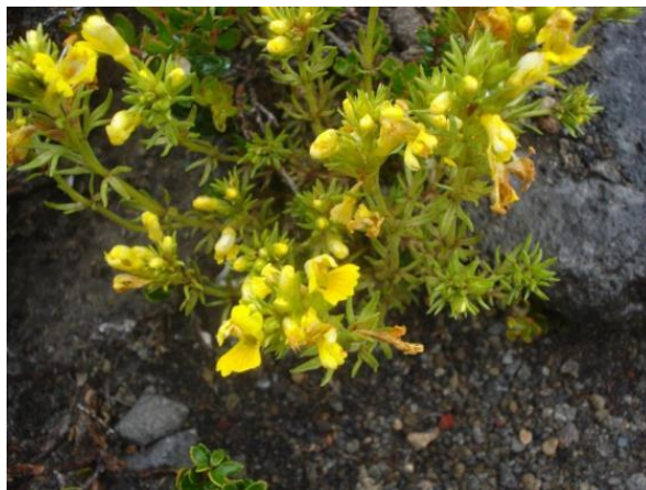
Figura 19. Euphrasia subexserta , hábito y flores.

https://www.biodiversitylibrary.org/page/162235#page/560/mode/1up