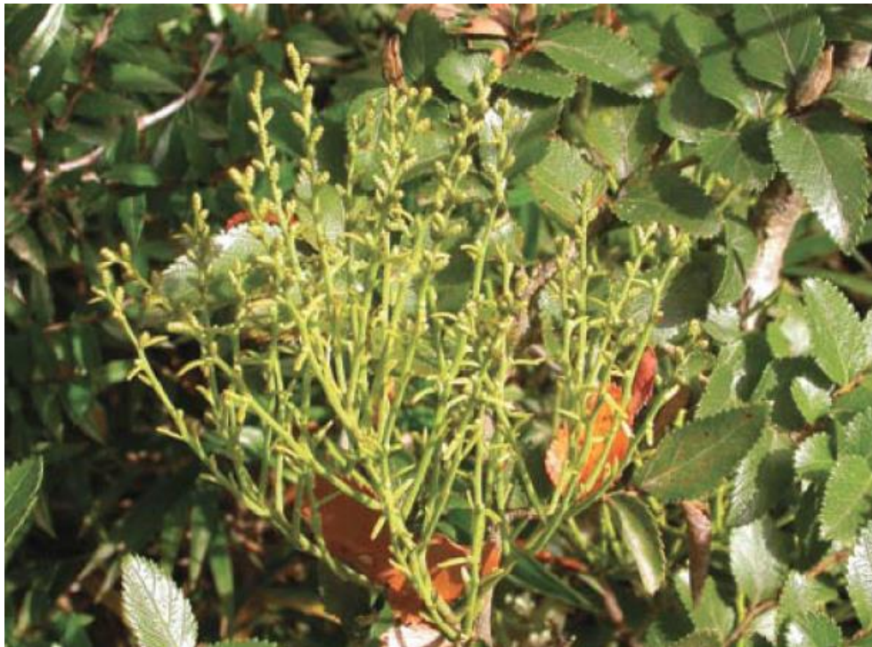
Figura 44. Misodendrum gayanum . Hábito. Fotografía en Marticorena et al. (2010).

Referencias: Marticorena, A., D. Alarcón, L. Abello & C. Atala. 2010. Guía de campo de plantas trepadoras, epífitas y parásitas nativas de Chile. 252-253.