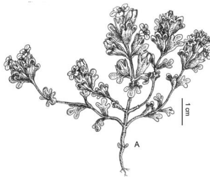
Figura 11. Euphrasia adenonota , ilustración tomada de Ortiz et al. (2021).

https://www.biodiversitylibrary.org/page/40455219#page/334/mode/1up