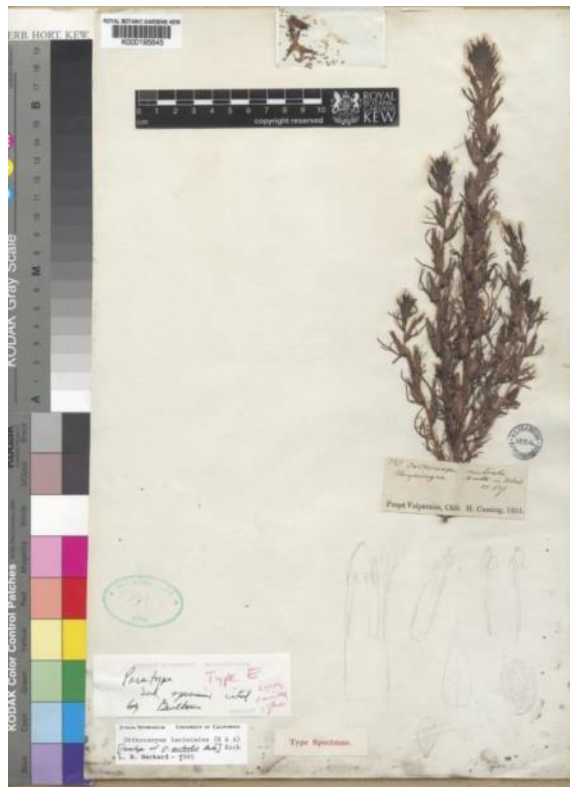
Figura 8: Castilleja laciniata , ejemplar coleccionado en Valparaíso. Herbario del Kew Garden.