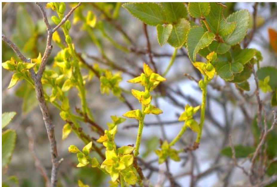
Figura 46. Misodendrum macrolepis , hábito y hojas. Cordillera de San Pedro. Prov. Chiloé. Sobre Nothofagus nitida .