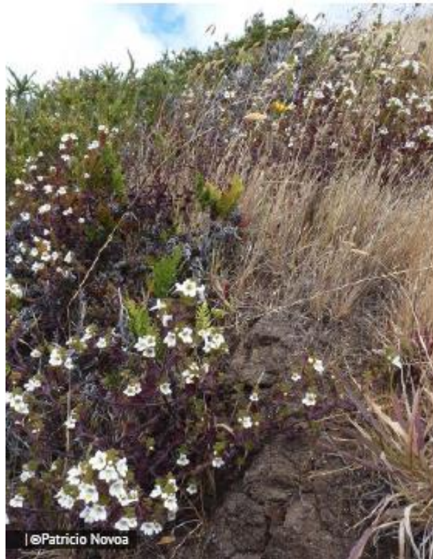
Figura 16. Euphrasia formosissima , en la isla Robinson Crusoe.