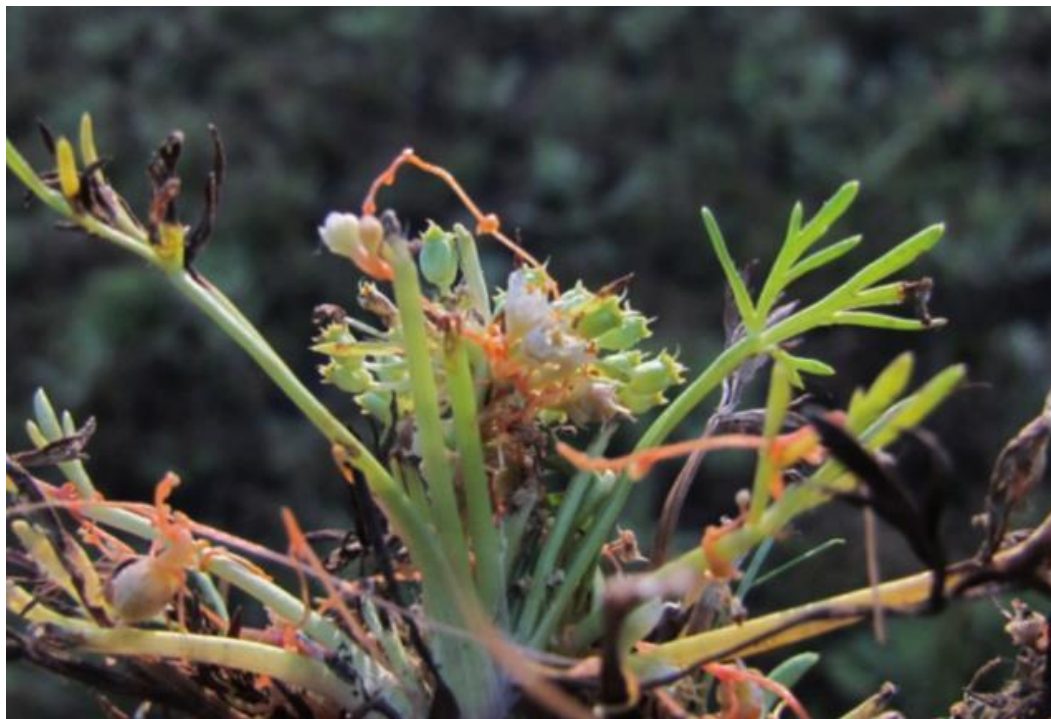
Figura 65. Cuscuta pauciflora , en una especie de Azorella herbácea. Reserva Biológica Huilo Huilo.

Estado de conservación: especie de distribución restringida, se ha propuesto clasificarla en la categoría de vulnerable. Especie ubicada mucho tiempo en la sinonimia de C. micrantha , rehabilitada en 1943.