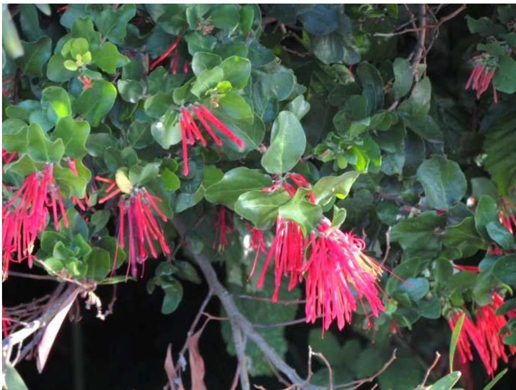
Figura 40. Tristerix corymbosus , ejemplar con flores. Fresia, Región de los Lagos.

Referencias: Referencias: Navas, L.E. 1976. Flora de la cuenca de Santiago. Vol. II: 35-36. Hoffmann, A. E. 1980. Flora Silvestre de Chile. Zona Central. p.112. Kuijt, J. 2011. Flora de Chile 3(1): 17-18.