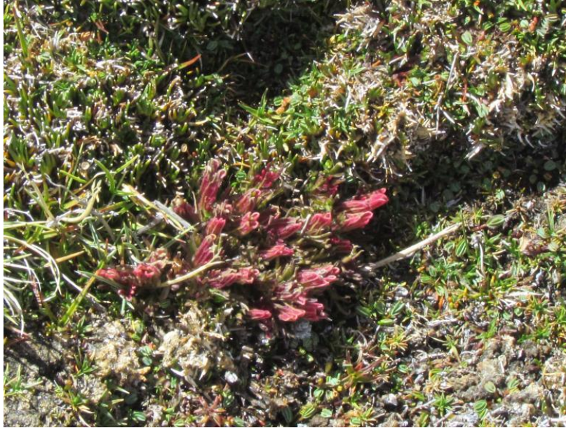
Figura 9. Castilleja pumila . Altiplano de Parinacota.