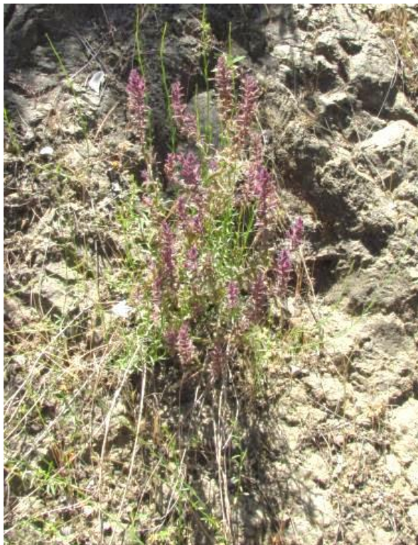
Figura 21. Neobartsia chilensis . Habito. Cuesta de Balmaceda, provincia de Valparaíso.

Reiche. Flora de Chile, 1911. Vol. 6: 96.