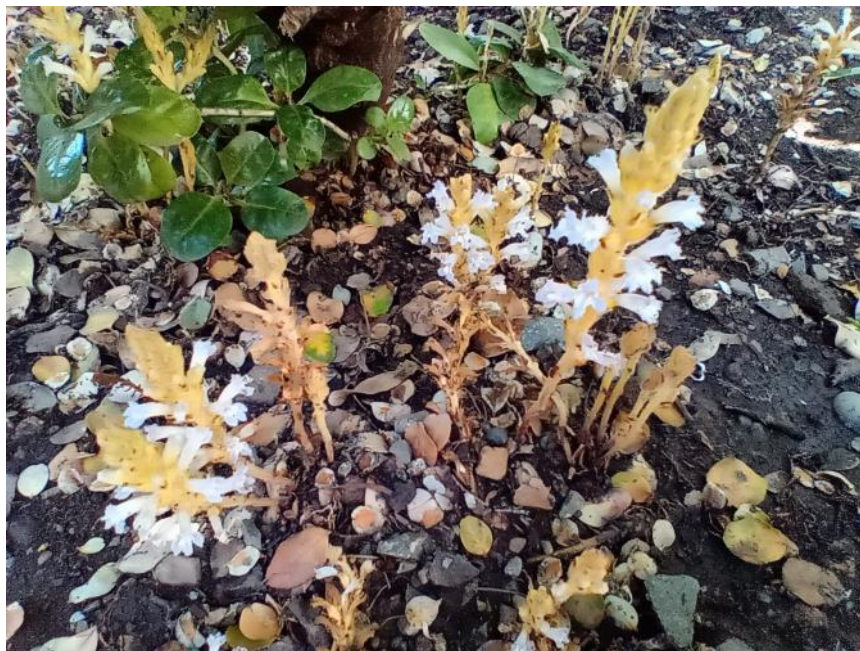
Figura 27. Orobanche ramosa . En un jardín de la ciudad de Santiago.