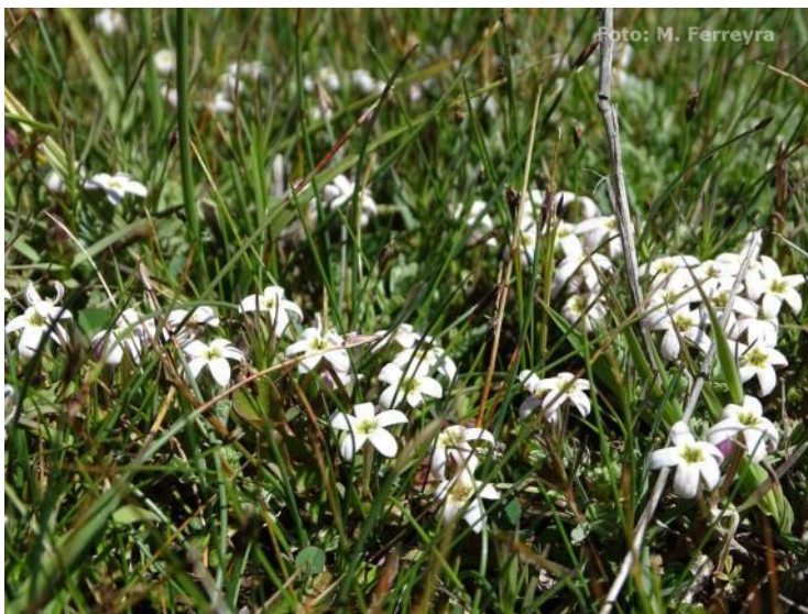
Figura 57. Arjona pusilla . Flores.

Estado de conservación: se desconoce. Por su amplia distribución en Argentina aparentemente no tendría problemas de conservación, pero en Chile es una planta escasa.