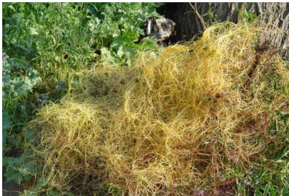
Figura 61. Cuscuta chilensis , hábito.

Referencia: Navas, L.E. 1979. Flora de la cuenca de Santiago. Vol. III: 39.