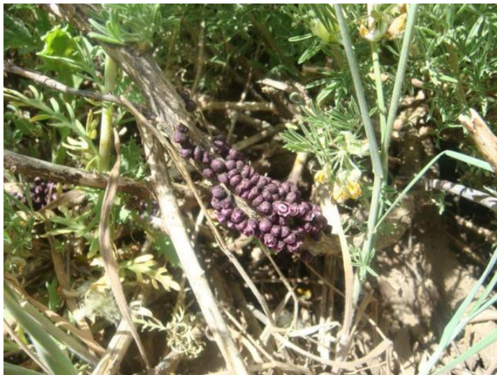
Figura 1. Pilostyles berteroi sobre Adesmia gracilis . Región Metropolitana, monumento natural El Morado.