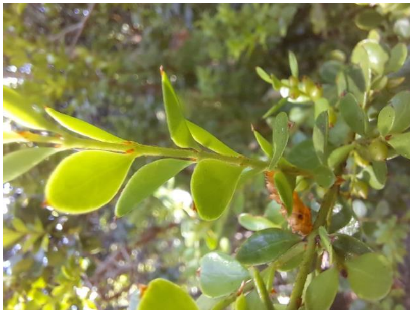
Figura 51. Lepidoceras chilense , detalle de las hojas apiculadas. Polcura, Región del Biobío.