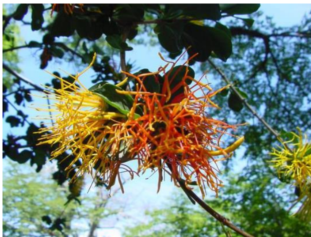
Figura 33. Desmaria mutabilis , ejemplar florecido.

Referencia: Hoffmann, A.E. 1982. Flora silvestre de Chile. Zona Austral. 258 pp. Kuijt, J. 2011. Flora de Chile 3(1): 9-10.