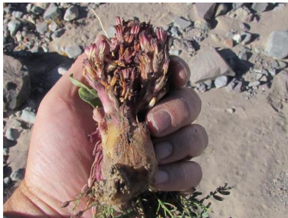
Figura 28. Orobanche tarapacana . Crece en los alrededores de Mamiña, Región de Tarapacá.

Estado de conservación: especie con distribución restringida, escasamente recolectadas. Por su estrecha distribución geográfica, debería tener asignado algún grado de amenaza.