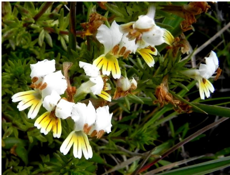
Figura 20. Euphrasia trifida , hábito y flores. Fotografía: E. Thielemann.

https://www.biodiversitylibrary.org/page/162235#page/560/mode/1up