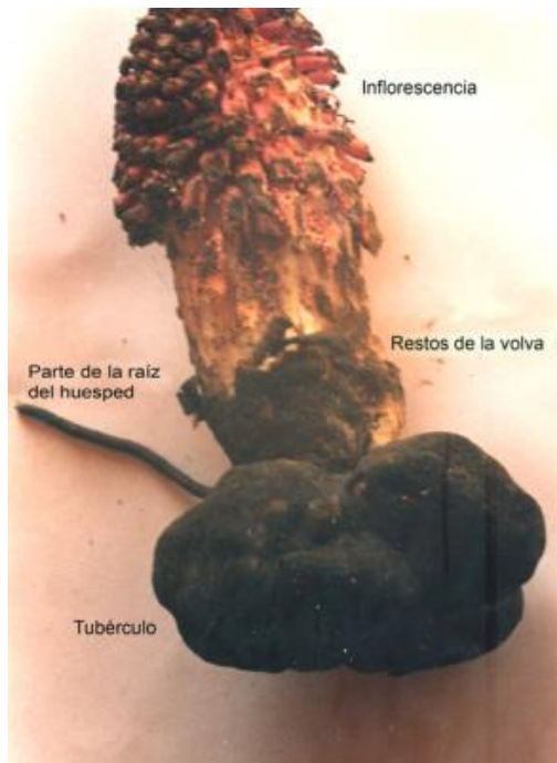
Figura 32. Ombrophytum subterraneum (Aspl.) B. Hansen, uso como alimento en Chile: aspecto de la planta