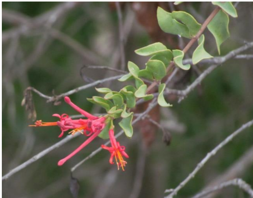
Figura 42. Tristerix verticillatus , rama florida, Longotoma, provincia de Petorca.