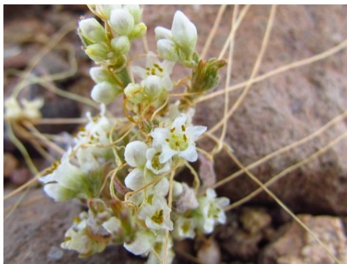
Figura 63. Cuscuta micrantha . Hábito y flores.

Referencia: Navas, L.E. 1979. Flora de la cuenca de Santiago. Vol. III: 40.