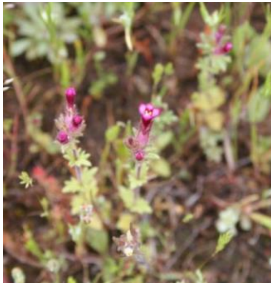
Figura 30. Parentucellia latifolia . Flores. Coleccionada en Valparaíso