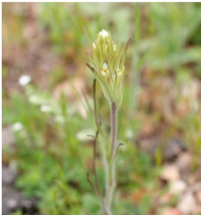
Figura 7. Castilleja attenuata . Coleccionada en la cuenca de la laguna de Aculeo.

Distribución: especie alóctona asilvestrada. Se encuentra entre las regiones de Valparaíso y Biobío.