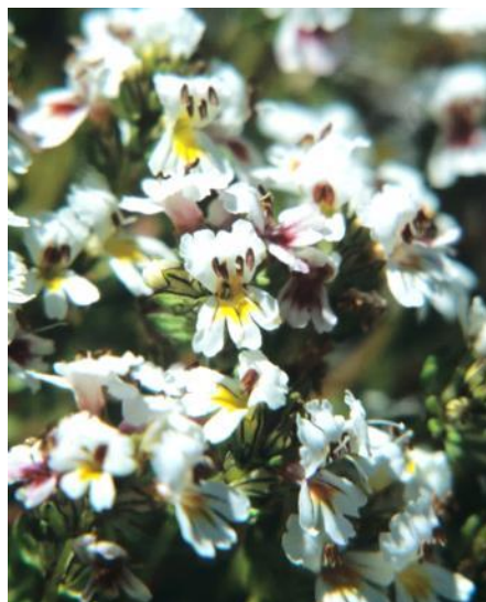
Figura 12. Euphrasia andicola .

https://www.biodiversitylibrary.org/page/162235#page/560/mode/1up