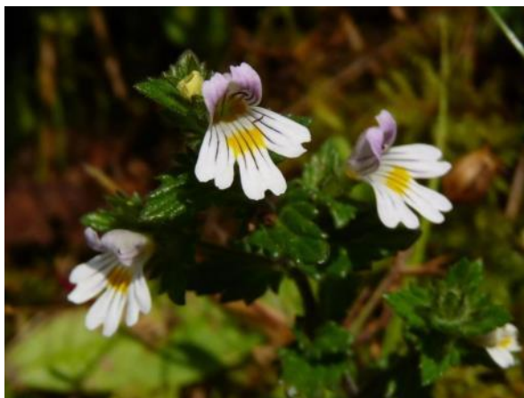
Figura 18. Euphrasia officinalis . Fotografía de referencia. (Astovka en el sitio de Kew Garden).