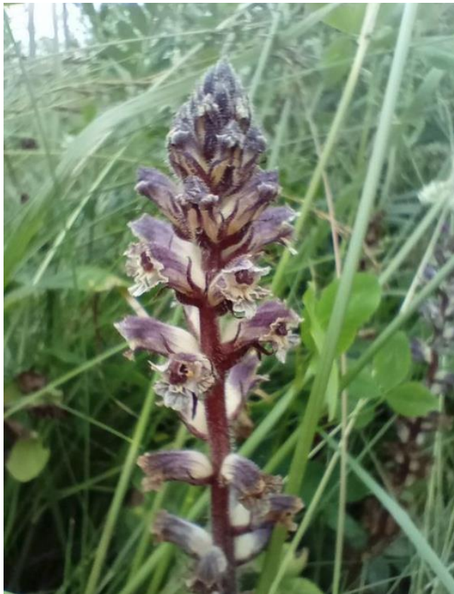
Figura 26. Orobanche minor , imagen de referencia. John Barkla (I. Naturalist)