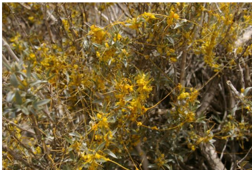
Figura 64. Cuscuta microstyla , hábito. Cajón del río Olivares, Región Metropolitana.

Estado de conservación: Por su amplia distribución, no se considera bajo amenaza.