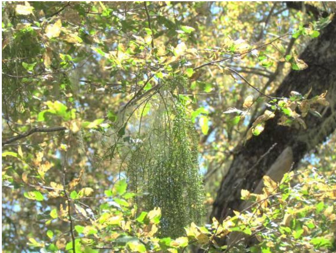
Figura 45. Misodendrum linearifolium . Hábito e inflorescencias. Neltume, Región de los Ríos.