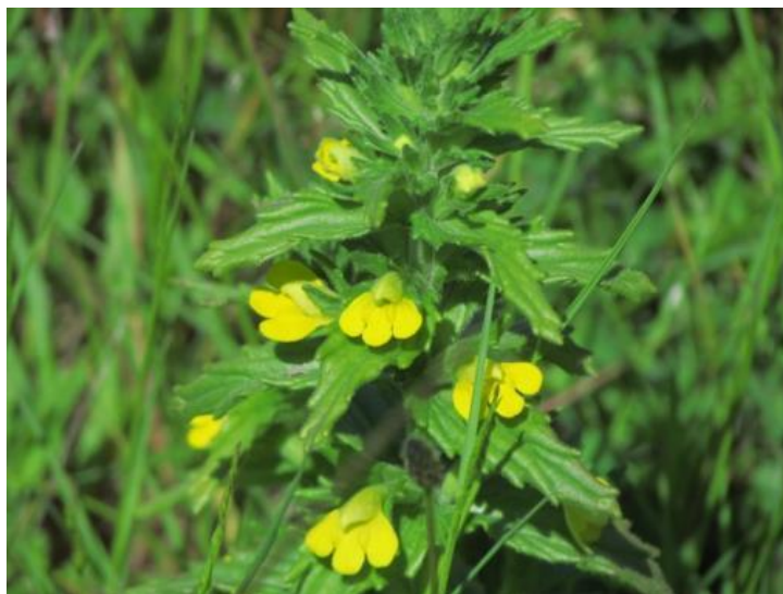
Figura 6. Bellardia viscosa . Ciruelos, Región de los Ríos.

Distribución: especie alóctona asilvestrada. Crece desde la Región Metropolitana hasta la de Aysén.