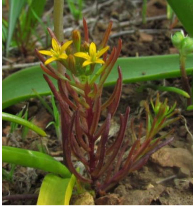
Figura 60. Quinchamalium chilense , costa de Constitución, Región del Maule.