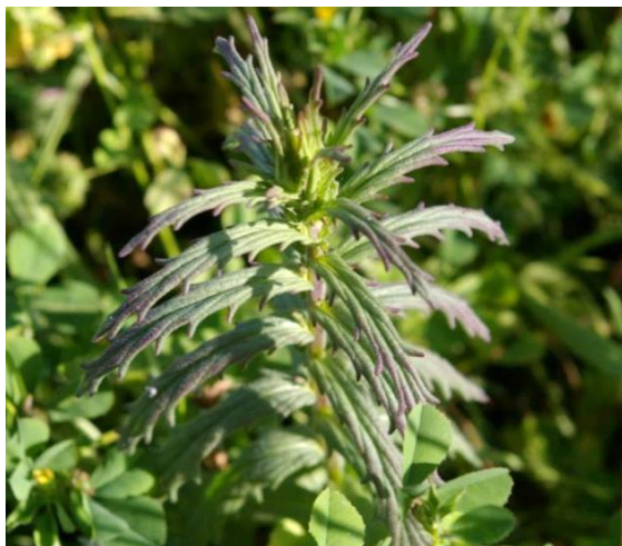
Figura 5. Bartsia trixago . Coleccionada en el litoral de Valparaíso. Flores.