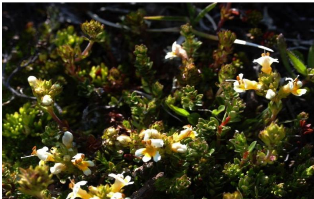
Figura 17. Euphrasia muscosa .

Referencias: Philippi, R. A. 1873. Anales de la Universidad de Chile 43: 528.