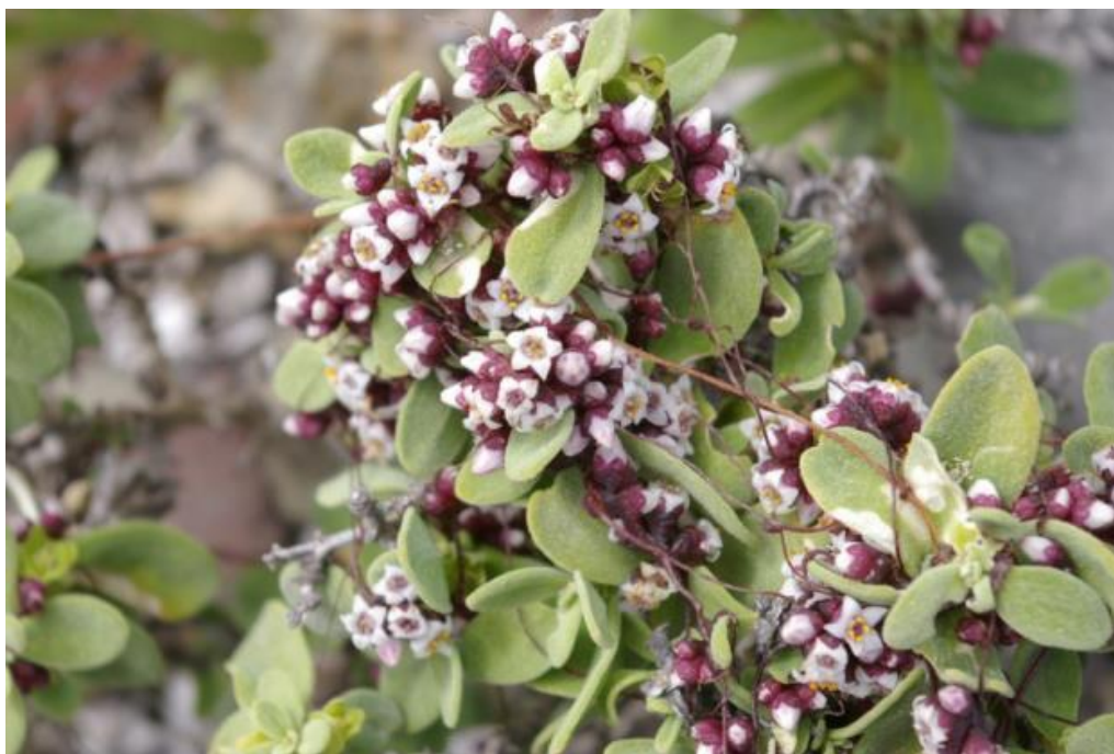
Figura 66. Cuscuta purpurata , hábito y flores en Tetragonia maritima (Aizoaceae). Caldera, Región de Atacama.

Estado de conservación: tiene un área de extensión de presencia amplia y es muy polífaga por lo que no debería tener problemas de conservación.