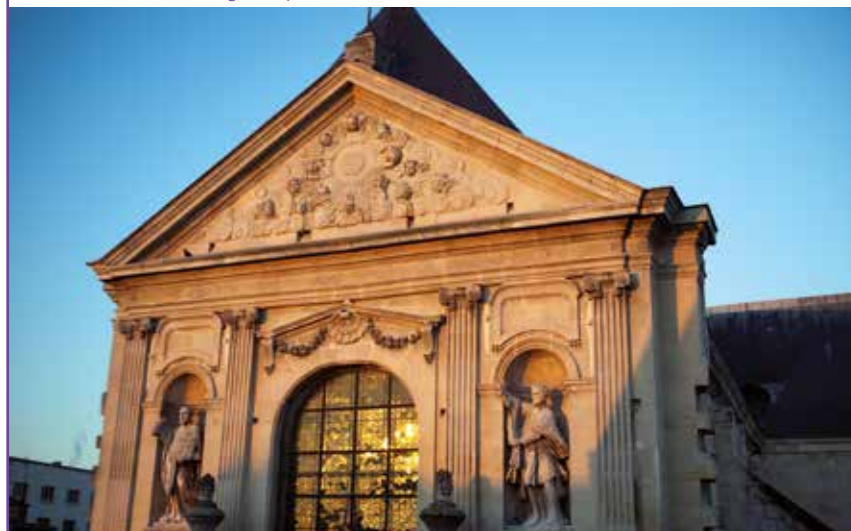
La chapelle Corneille, associée au Hangar 23, à la salle Jovet et à la chapelle Saint-Louis pour une saison riche.