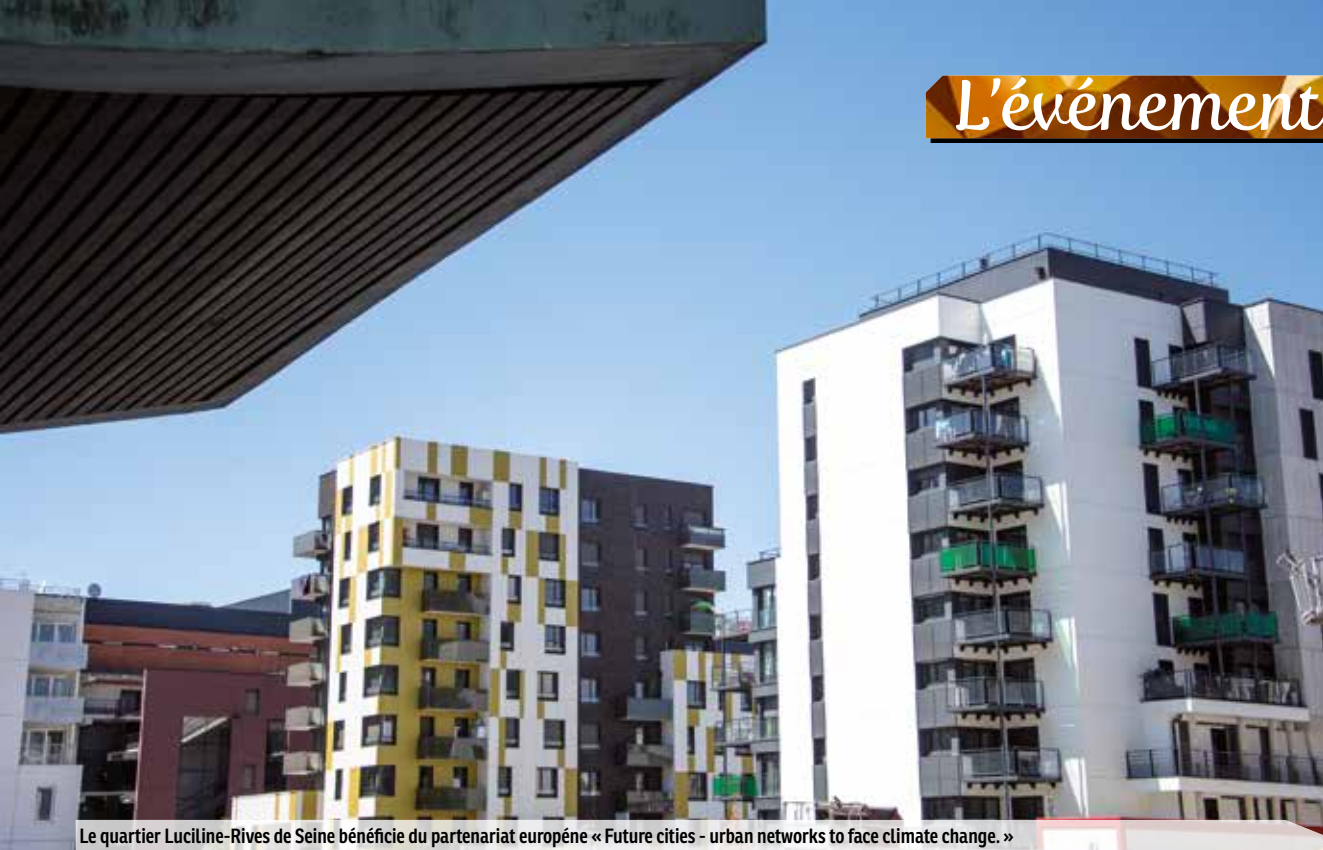
Le quartier Luciline-Rives de Seine bénéficie du partenariat européen « Future cities – urban networks to face climate change. »