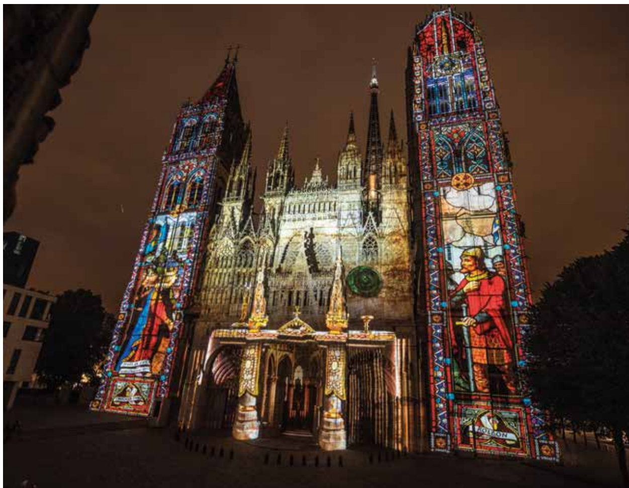
Le spectacle son et lumière proposé par la Métropole, « Cathédrale de lumière » est encore à voir tous les soirs à 21 h 30 sur le parvis de Notre-Dame. Jusqu'au 27 septembre, les Vikings et Les Jeanne n'attendent que vous à la nuit tombée. Et c'est gratuit!