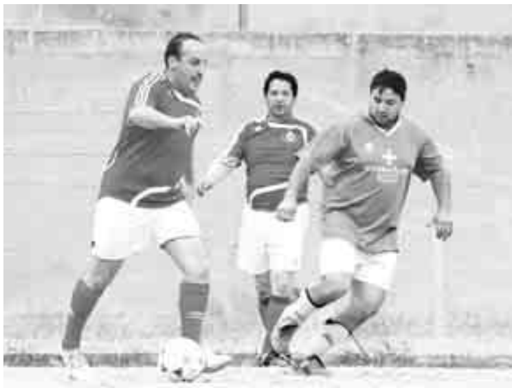
Un momento del choque entre Domaio y Señorío de Rubiós

Mientras tanto, sigue disputándose el Trofeo Deportes Balbi, que se encuentra en su primera fase. El Santa Eulalia, el Dunas, A Canuda, Noribérica y Deco Cabral son los líderes en los cuatro grupos en que está dividida la competición. A Canuda y el Noribérica son los que están más igualados en el grupo tercero, donde hay más emoción y partidos interesantes.