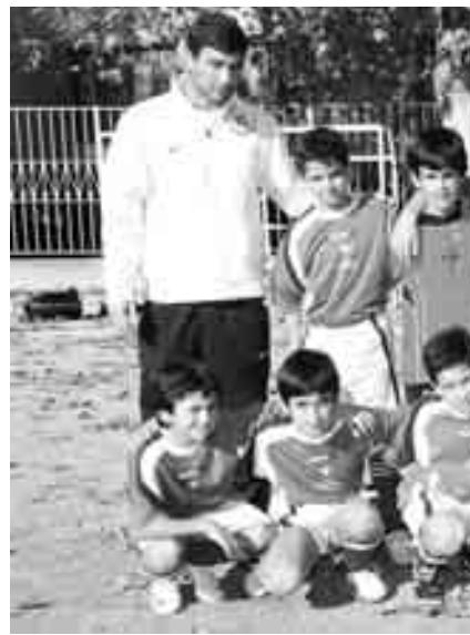
Los alevines del Colegio Apóstol / E. Álvarez

En el grupo segundo es el Santa Mariña C el que ocupa el primer lugar. Son cinco victorias consecutivas y ya ha logrado anotar 45 goles a su favor en este torneo.