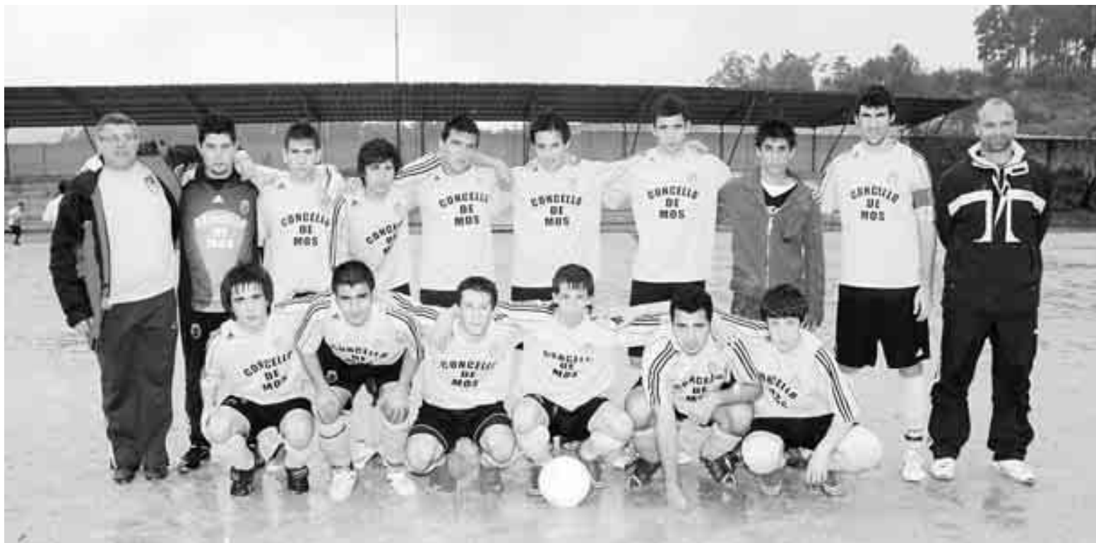
El equipo juvenil del Mos / E. Álvarez