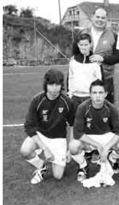
El equipo cadete del Louro / E. Álvarez

El Gondomar y el Mondariz se mantienen en la lucha por ganar el título de campeón del grupo doce de la categoría cadete. Desde el comienzo de la temporada mantienen una fuerte rivalidad, que sigue vigente en el tramo decisivo de la competición. El Gondomar ocupa la primera posición tras superar por un ajustado 1-2 al Ribera. El partido, tal como refleja el marcador final, estuvo presidido por la igualdad. Los visitantes debieron soportar la presión hasta el último minuto. Pero la demostración de su poder ofensivo la dio el Mondariz, que se impuso por 0-11 en el campo del Pontellas. El Mondariz se mantiene a dos puntos del líder y quiere aprovecharse de cualquier descuido de su rival para poder alcanzar el primer puesto.