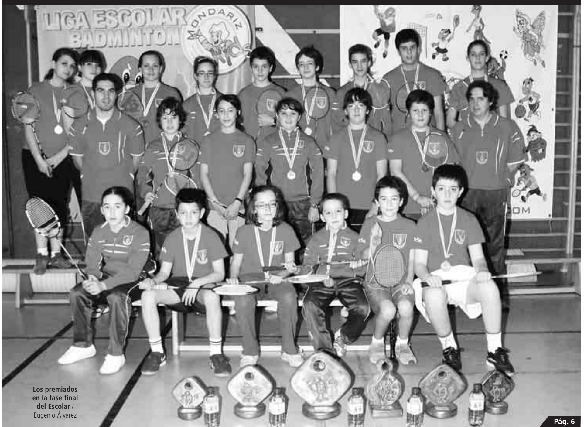
Los premiados en la fase final del Escolar / Eugenio Álvarez