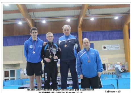
Finales Individuelles Départementales par Classement BETHUNE-BEUVRY le 20 mars 2016