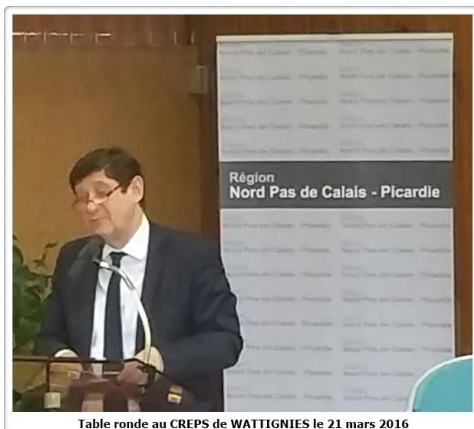
Table ronde au CREPS de WATTIGNIES le 21 mars 2016

La Ligue et les deux Comités départementaux étaient représentés par leur président respectif.