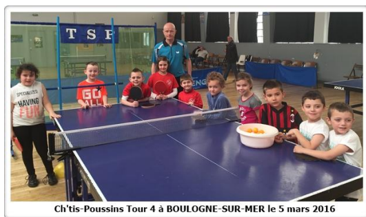
Ch'tis-Poussins Tour 4 à BOULOGNE-SUR-MER le 5 mars 2016