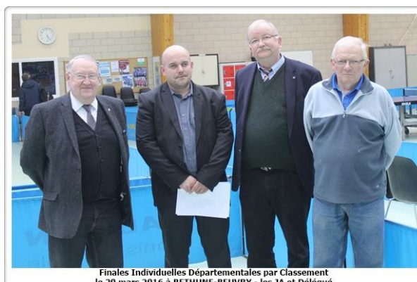
Finales Individuelles Départementales par Classement le 20 mars 2016 à BETHUNE-BEUVRY - les JA et Délégué