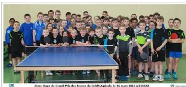
2ème étape du Grand-Prix des Jeunes du Crédit Agricole, le 26 mars 2016 à ESSARS

Tous les résultats des 1 ère et 2 ème étapes sont sur le site du CD62TT à l'adresse suivante : http://www.cd62tt.com/GPJ-CA.htm