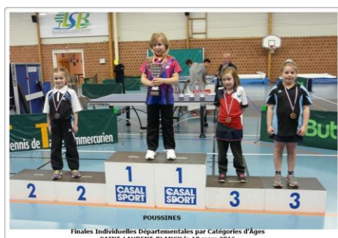
Finales Individuelles Départementales par Catégories d'Âges SAINT-LAURENT-BLANGY le 19 mars 2016