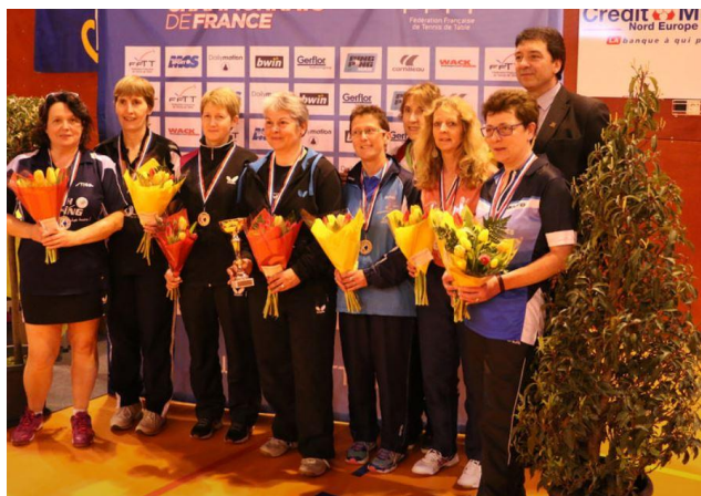
Double Dames V2