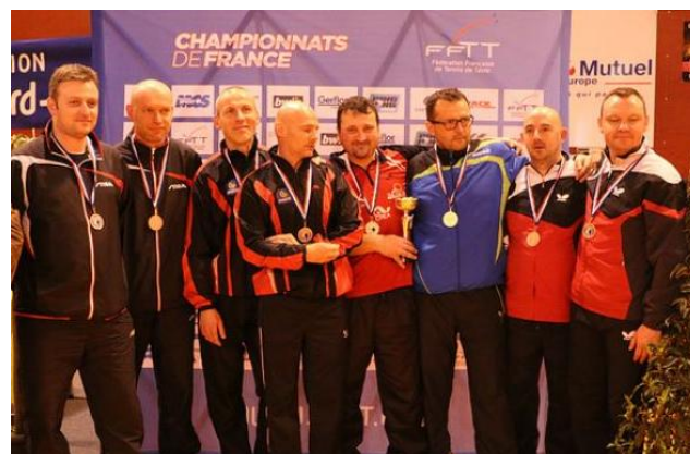
Double Messieurs V1