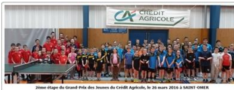
2ème étape du Grand-Prix des Jeunes du Crédit Agricole, le 26 mars 2016 à SAINT-OMER

Dans cette page, vous pourrez consulter les points accumulés de chaque participant