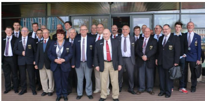
Le corps arbitral mobilisé pour l'évènement