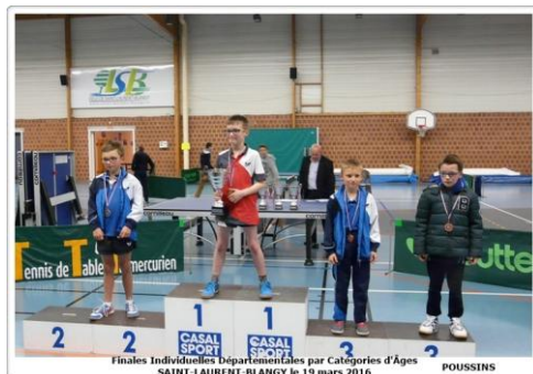
Finales Individuelles Départementales par Catégories d'Âges SAINT-LAURENT-BLANGY le 19 mars 2016