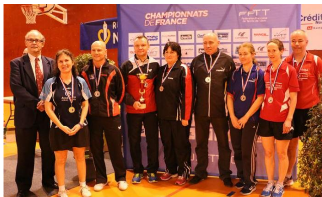
Double Mixte V1