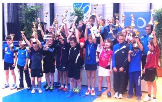
TOP de Détection Interregional de la Zone 6, les 26 et 27 mars 2016 à DEAUVILLE tous les récompenses