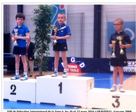
TOP de Détection Interregional de la Zone 6, les 26 et 27 mars 2016 à DEAUVILLE - Garçons 2008