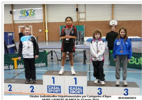
Finales Individuelles Départementales par Catégories d'Âges SAINT-LAURENT-BLANGY le 19 mars 2016