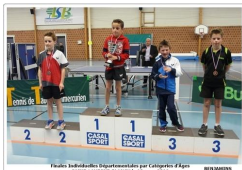
Finales Individuelles Départementales par Catégories d'Âges SAINT-LAURENT-BLANGY le 19 mars 2016