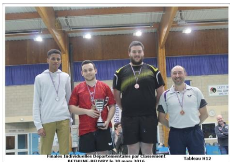
Finales Individuelles Départementales par Classement BETHUNE-BEUVRY le 20 mars 2016