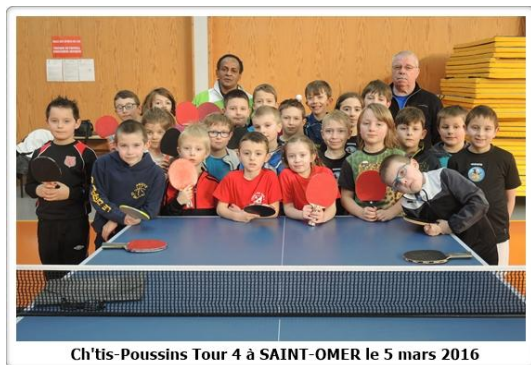
Ch'tis-Poussins Tour 4 à SAINT-OMER le 5 mars 2016