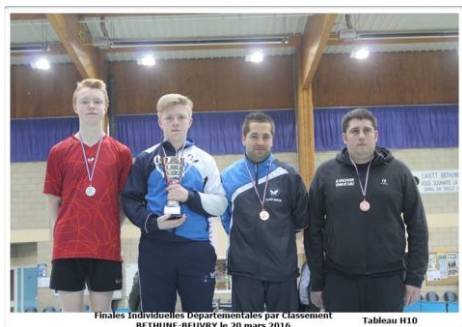
Finales Individuelles Départementales par Classement BETHUNE-BEUVRY le 20 mars 2016