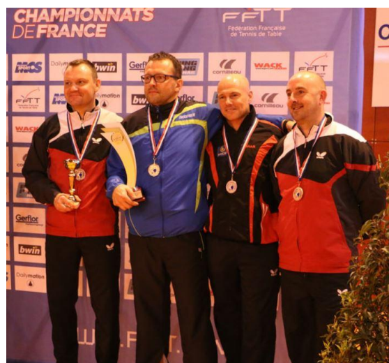
Simple Messieurs Vétérans 1