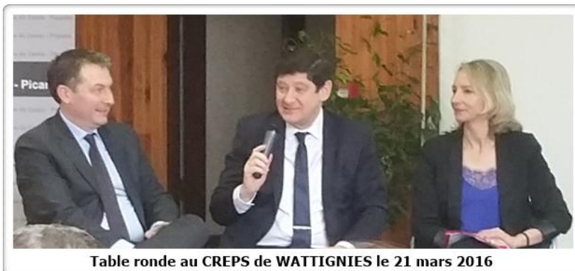
Table ronde au CREPS de WATTIGNIES le 21 mars 2016