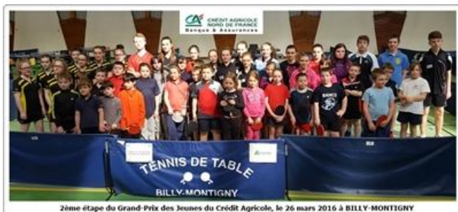
2ème étape du Grand-Prix des Jeunes du Crédit Agricole, le 26 mars 2016 à BILLY-MONTIGNY

Nous aurons le plaisir de nous rendre dans le Calaisis car les clubs du PPC MARCK, OTT CALAIS et Balzac TT CALAIS, vont organiser l'épreuve le dimanche 5 juin 2016. Préparez vos maillots de bain !