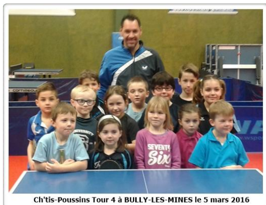
Ch'tis-Poussins Tour 4 à BULLY-LES-MINES le 5 mars 2016